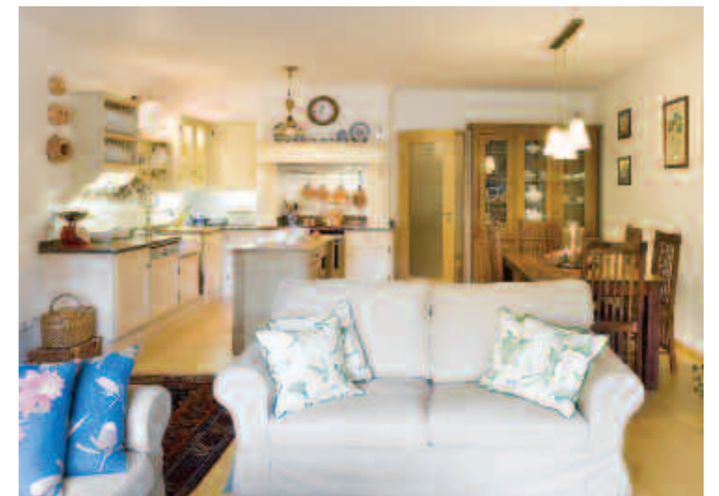
TRADIČNÍ ANGLICKÝ STYL