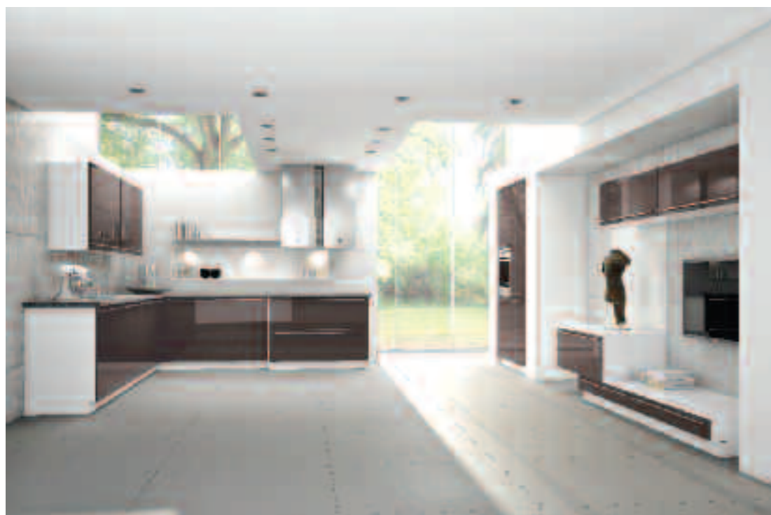
SKŘÍŇKY SESTAVY MANHATTAN

SKŘÍŇKY SESTAVY MANHATTAN z luxusní třídy Bauformat volně přecházejí z kuchyňské zóny do obývací části interiéru, a dávají mu tak jednotnou tvář. Cena 14 319 Kč za běžný metr. KUCHYŇNĚ ORESI, www.kuchyne-oresi.cz