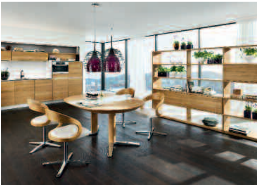
ELEGANTNÍ PŘÍRODNÍ DŘEVO