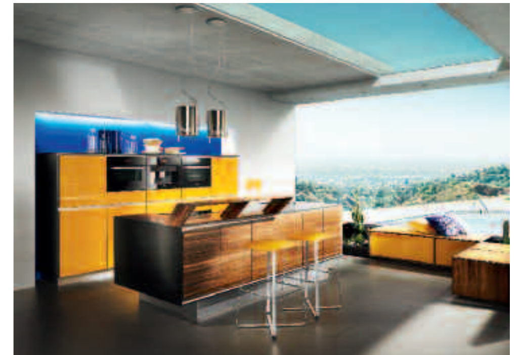
MASIVNÍ PŘÍRODNÍ OŘECH