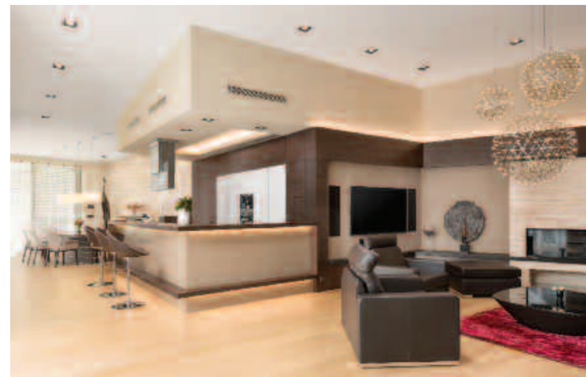
ELITE Z KOLEKCE PREMIUM

VÝSUVNÉ MECHANISMY , integrované LED osvětlení, police, příborníky a další výbavu v podobě zárovek zahrnuje kuchyně L1 od firmy Team 7. Kompletní cena 890 834 Kč . DECOLAND, www.decoland.cz