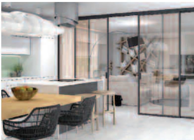
ELEGANTNÍ DVEŘE STRONG

ELEGANTNÍ DVEŘE STRONG , tvořené hliníkovým rámem a skleněnou výplní, umožní variabilně propojovat a oddělovat obývací pokoj a kuchyni. Prostor tak získá potřebnou vzdušnost a lehkost. Cena dveří od 7 996 Kč . J.A.P., www.dvere-jap.cz