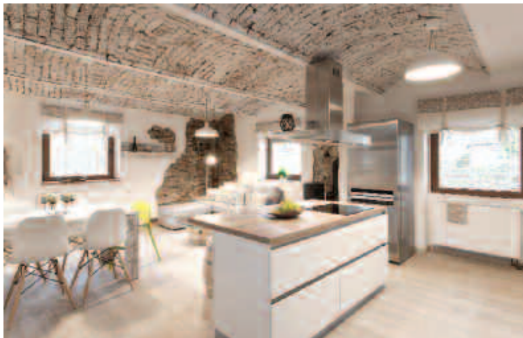
OSTRŮVEK S VARNÝM CENTREM

OSTRŮVEK S VARNÝM CENTREM odděluje kuchyň od obývacího pokoje. Cena bílého nábytku, model Bellisa z prémiové třídy Livanza , je od 9 251 Kč za běžný metr. KUCHYNĚ ORESI, www.kuchyne-oresi.cz