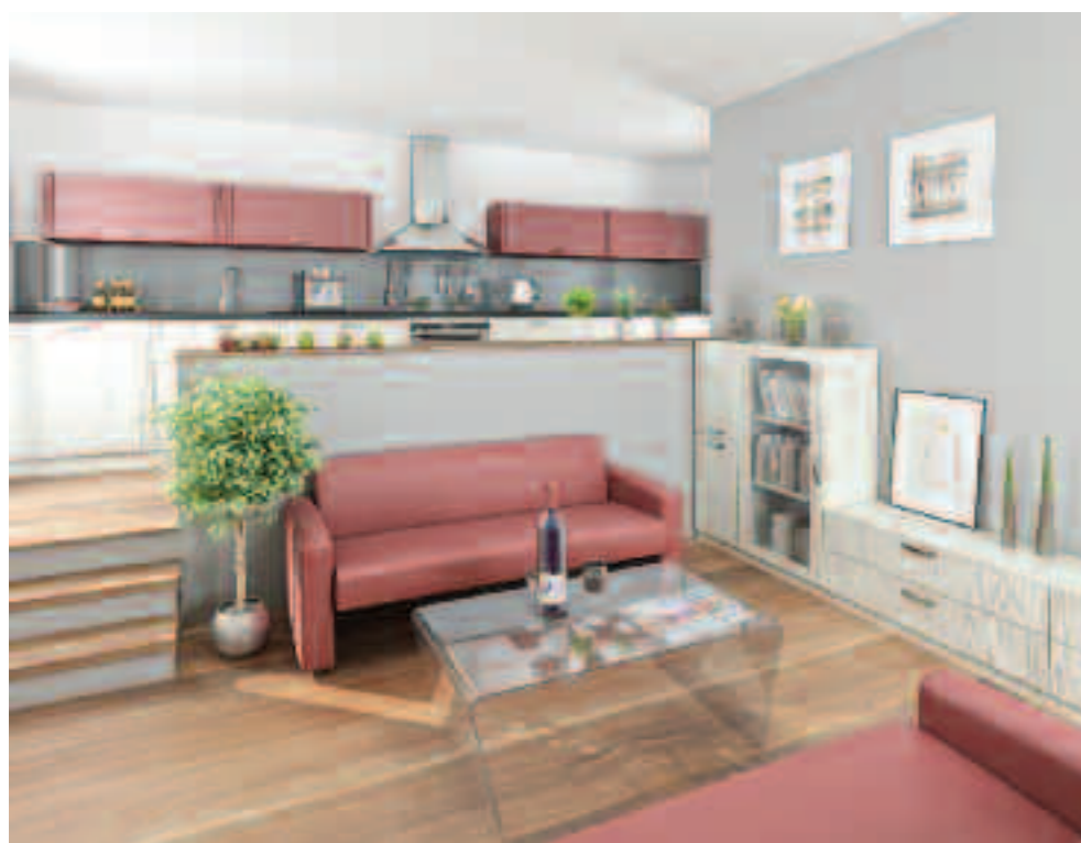
MÍRNÉ VYVÝŠENÍ KUCHYŇSKÉHO KOUTU