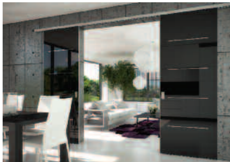
POSUVNÝ SYSTÉM TRIX ZERO

POSUVNÝ SYSTÉM Trix zero je v kombinaci s velkými dvoukřídlymi dveřmi Master ideální ke snadnému spojení kuchyňské a obývací zóny interiéru. Cena od 7 079 Kč . J.A.P., www.posuvny-system.cz