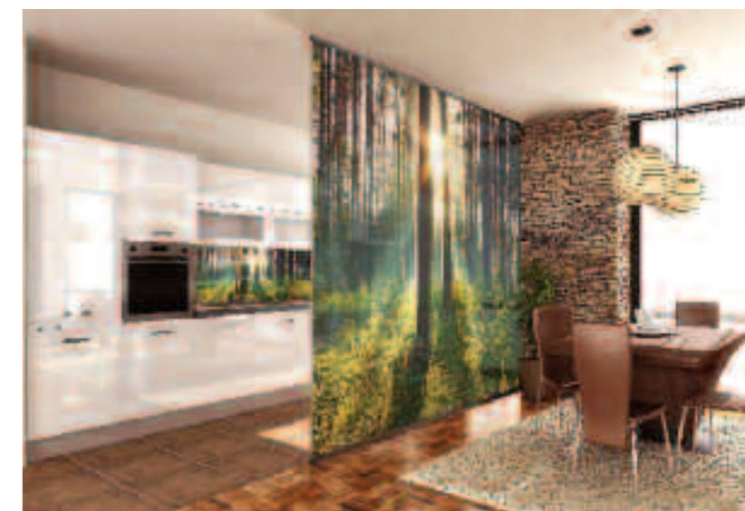
NETRADIČNÍ ZPŮSOB ODDĚLENÍ OBYVACÍHO PROSTORU