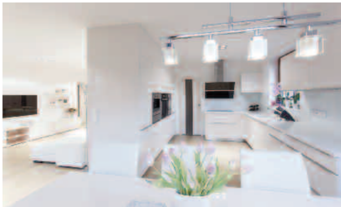
SEDMIVRSTVÝ BÍLÝ LAK

SEDMIVRSTVÝ BÍLÝ LAK ve vysokém lesku je synonymem kvality, odolnosti a exkluzivity. Materiál rezistentní vůči poškrábání vévodí interiéru, jehož součástí je i kuchyně Comfort z kolekce Premium . Cena podle rozsahu zakázky. HANÁK NÁBYTEK, www.hanak-nabytek.cz